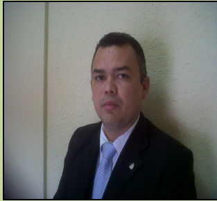
COMPILADOR: EDWIN NATANAHEL SANCHEZ NAVAS FEBRERO- 2,011

Abogado, Universidad Nacional Autónoma de Honduras, Máster en “Tecnología Geo Ambiental” Universidad Tecnológica Centro Americana y Universidad Politécnica de Madrid, Participante en: III-Curso Regional de Derecho Ambiental y II Modulo de la “Maestría Centro Americana en Derecho Ambiental” en la Universidad Popular de Nicaragua.